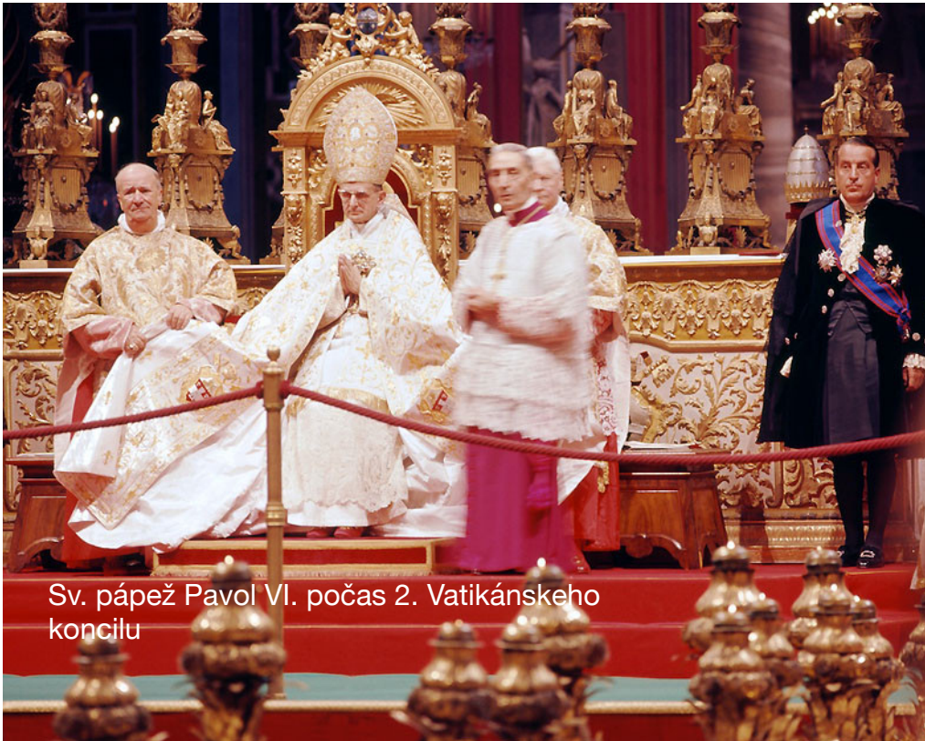
Sv. pápež Pavol VI. počas 2. Vatikánskeho koncilu

Aj v dnešnej dobe sa predstavení cirkvi sporadicky stretávajú spoločne, kde sa riešia páľčivé otázky doby, v ktorej sa veriaci nachádzajú a potrebujú jasné slovo pravdy. Najväčšími a najdôležitejšími stretnutiami sú tzv. koncily, potom synody. Posledným koncilom bol 2. Vatikánsky koncil v rokoch 1962 - 1965. Okrem neho sa pápež a biskupi celého sveta stretávali na menších